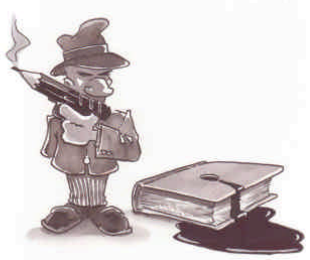
Luc Turlan, tous droits réservés